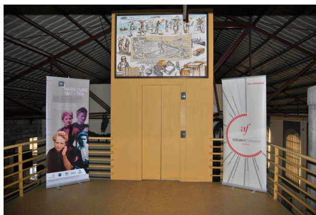
Il y en avait du monde au Musée du Travail Michel Giacometti pour le début de la Fête de la Francophonie !