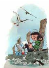
Gaston Lagaffe, par Franquin

Vous pouvez nous joindre aussi par téléphone portable : 918 595 110, et maintenant sur Facebook !