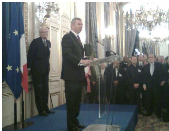
Quai d'Orsay - lundi 30 janvier 2012 M. Henri de Raincourt - Ministre chargé de la Coopération