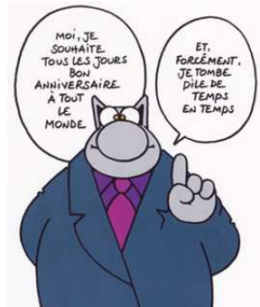
Le Chat, de Geluck