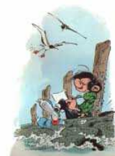
Gaston Lagaffe, par Franquin

Vous pouvez nous joindre aussi par téléphone portable : 918 595 110, et bientôt sur Facebook !