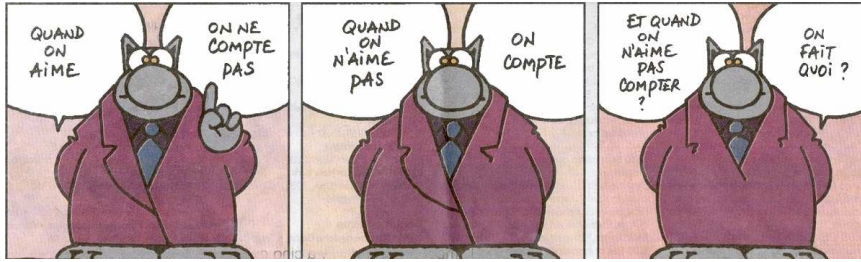
Le Chat, de Geluck.